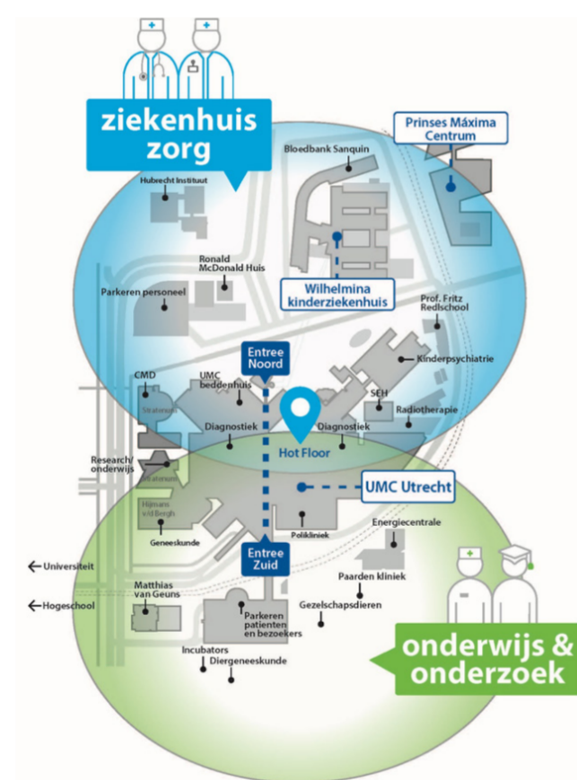
Afbeelding: Principes vernieuwing Universitair Medisch Centrum Utrecht

Door de toenemende dynamiek in het USP is het van belang de verschillende trends en ontwikkelingen in samenhang te bezien en te vatten in een ruimtelijke visie op de toekomst van dit gebied waarmee sturing kan worden gegeven aan de komende initiatieven en ontwikkelingen.